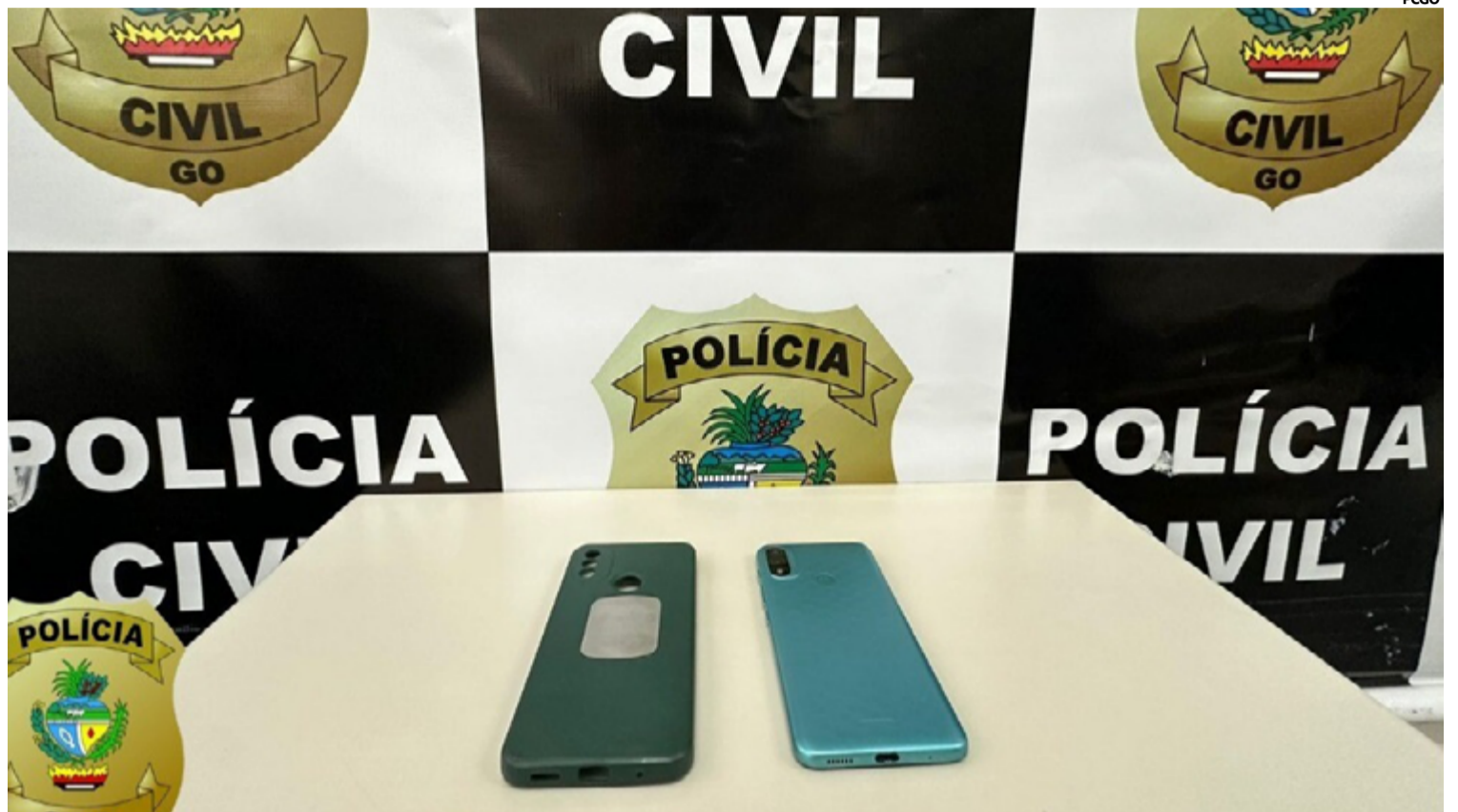
O crime ocorreu quando a vítima foi abordada por um indivíduo que, simulando estar armado, ameaçou atirar caso o celular não fosse entregue

Após a ocorrência, a equipe da Polícia Civil de Cidade Ocidental iniciou uma série de diligências com o objetivo de identificar os responsáveis por uma série de roubos a pedestres na região. Durante as investigações, os policiais conseguiram locali-