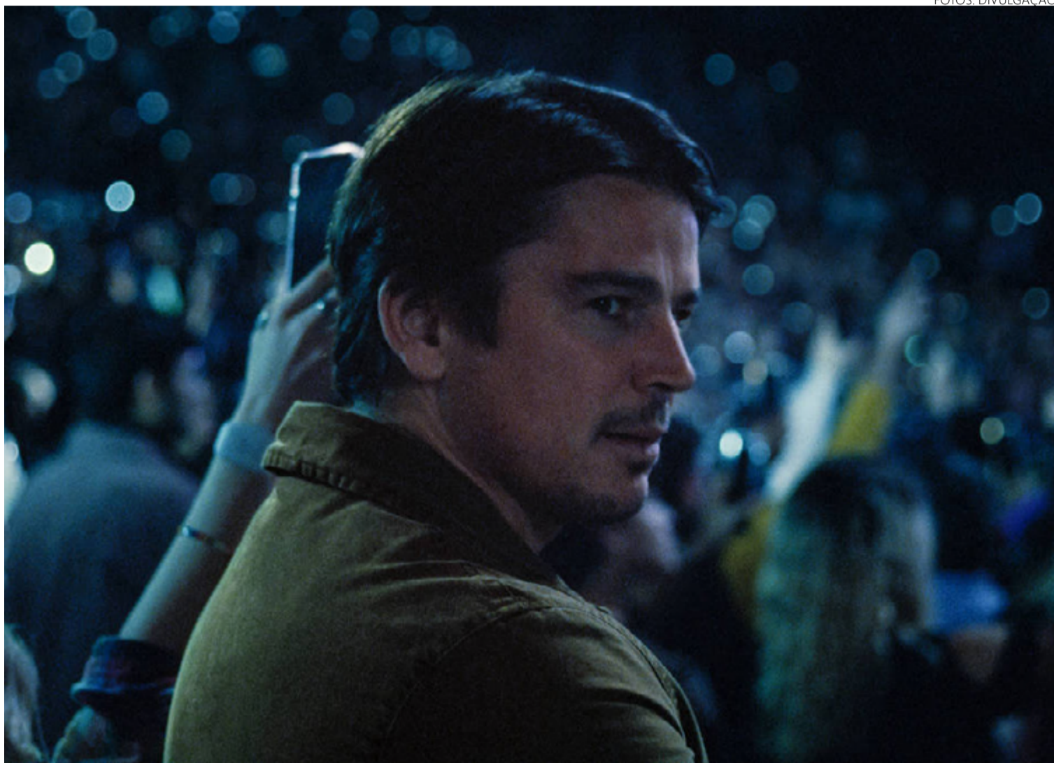
Josh Hartnett, ator: filme faz debate de relação entre pais e filhos algo hitchcockiana

O filme se diverte com o processo. Shyamalan evita o