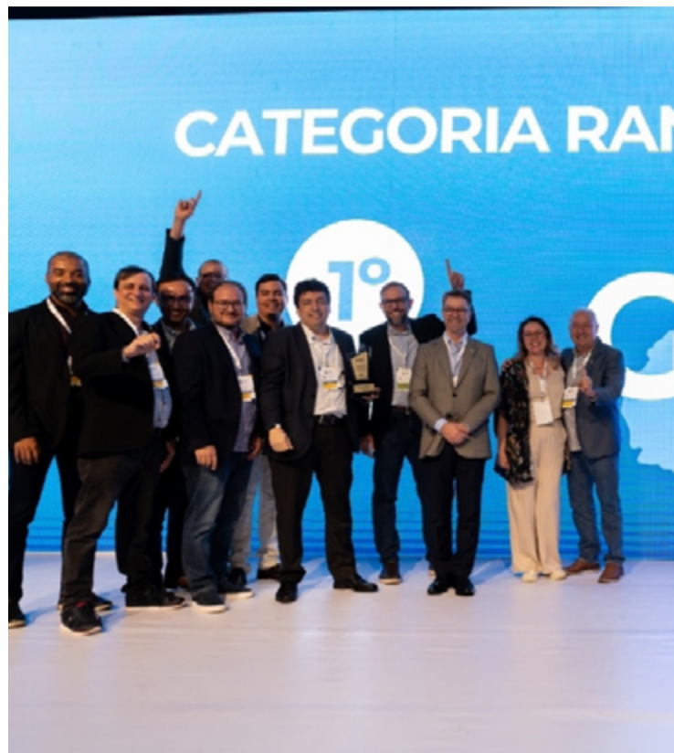
Goiás recebe prêmio do Índice ABEP-TIC de Oferta de Serviços Públicos Digitais no Rio de Janeiro

o estado estava obsoleto até 2018, o governador destacou ainda que a tecnologia proporciona redução de custos. Ele pontuou que a tendência é melhorar ainda mais, uma vez que Goiás hoje é um centro de pesquisa em inteligência artificial.