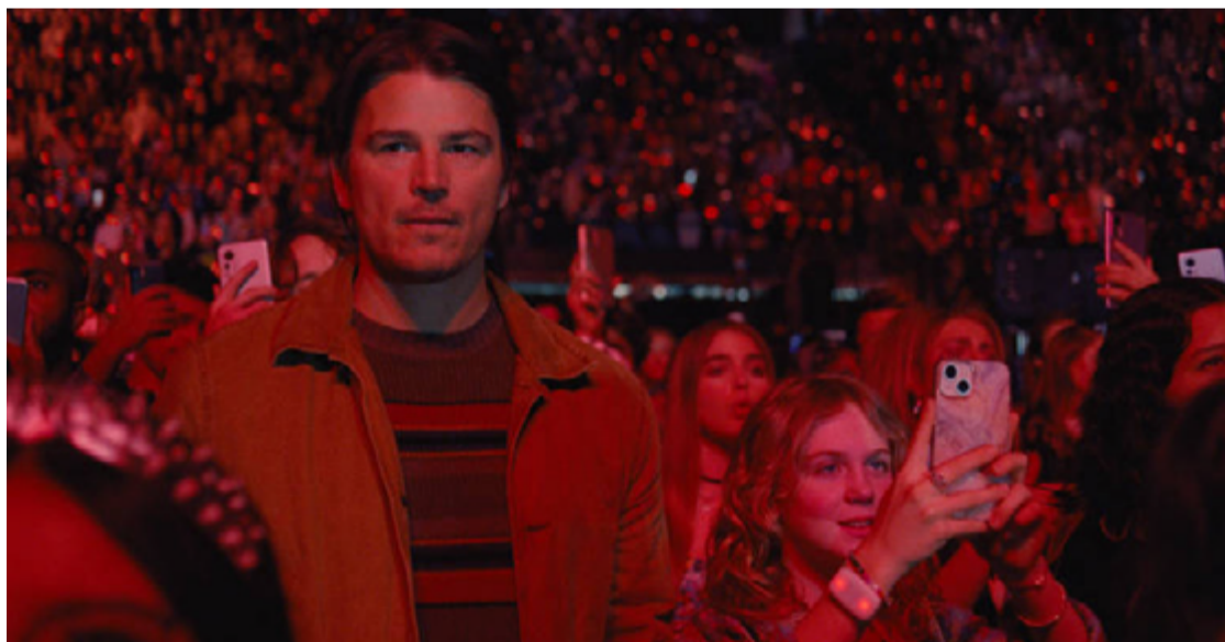
Pai e filha: história subjugada à mecânica da narrativa

realismo barato e brinca com uma encenação elaborada e de planos mirabolantes. Toda estratégia traçada pelo serial killer vira uma forma do longa explorar um lado diferente do show e, depois, do próprio protagonista.