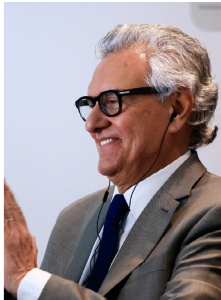
Ronaldo Caiado participa de cerimônia por meio de videoconferência: estado mais digital do país

"É um orgulho muito grande, porque o mundo passa por uma fase de transformação