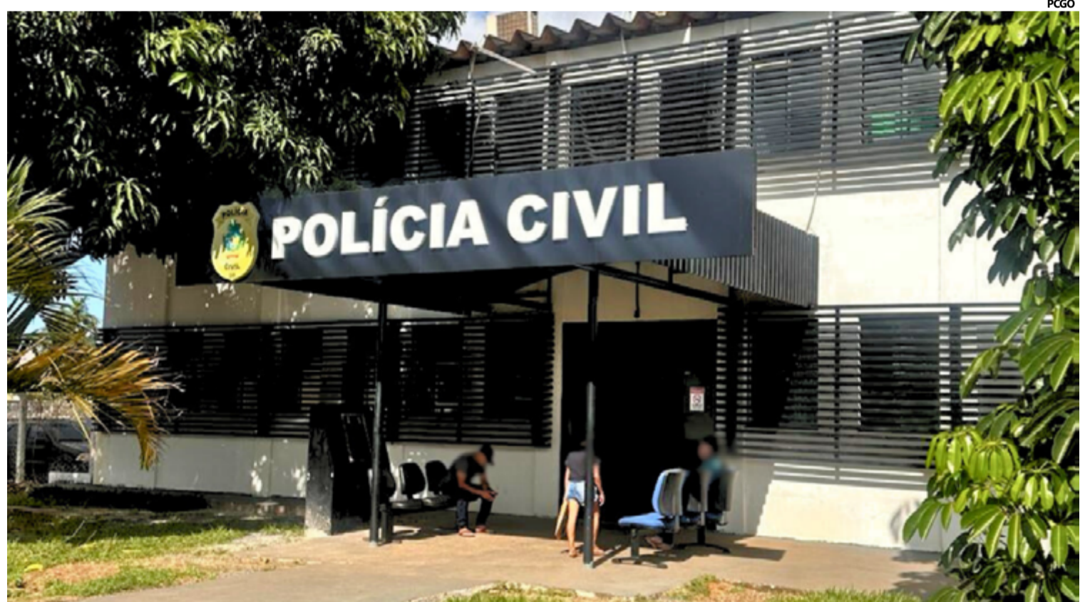
O incidente ocorreu durante uma discussão motivada por ciúmes, em que o agressor desferiu tapas e socos na vítima, causando-lhe diversas lesões

Os policiais conseguiram localizar o suspeito nas proximidades da casa de sua mãe, ainda em Novo Gama. Ele foi abordado e detido sem resistência, sendo conduzido imediatamente à delegacia para a formalização dos procedimen-