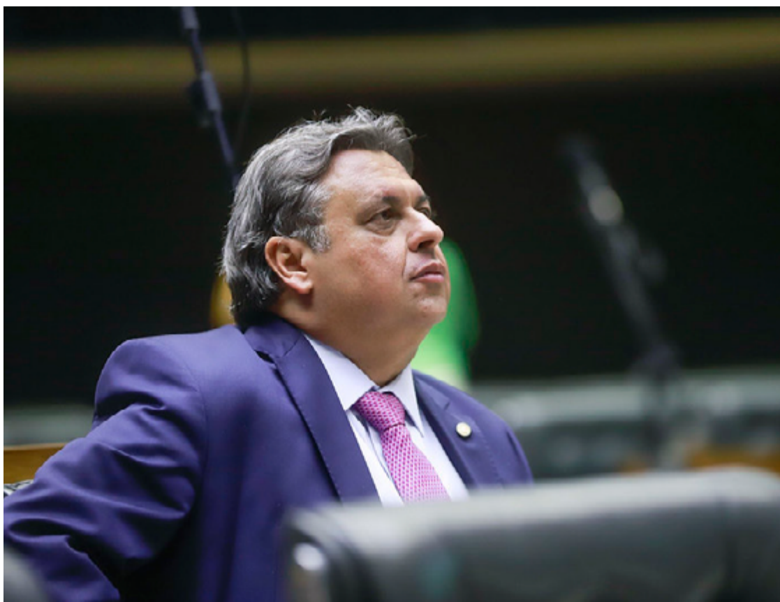
Julio Arcoverde (PI): sem acordo sobre emendas parlamentares governo Lula será penalizado

que conversará ainda com o presidente da Câmara dos Deputados, Arthur Lira (PP-AL), para saber como a Casa deve proceder em relação aos movimentos de STF e PGR.