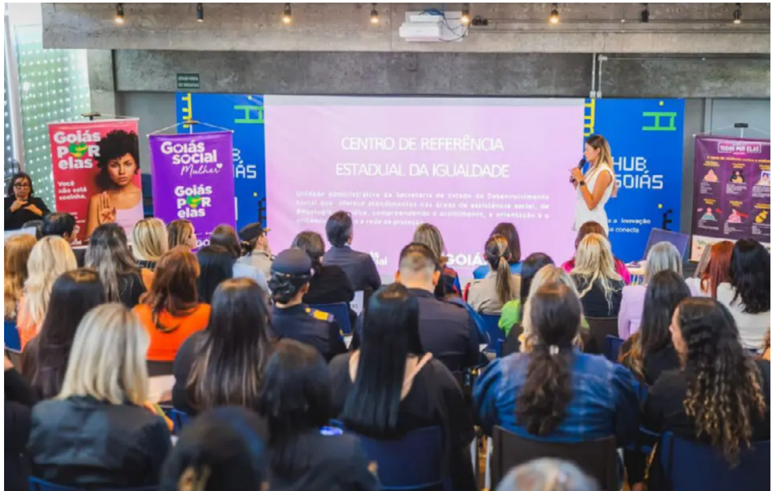
O Fórum teve como tema o enfrentamento de desafios na construção de políticas públicas para as mulheres

Matos destacou as ações da SEDS em prol das mulheres, como o programa Goiás Por